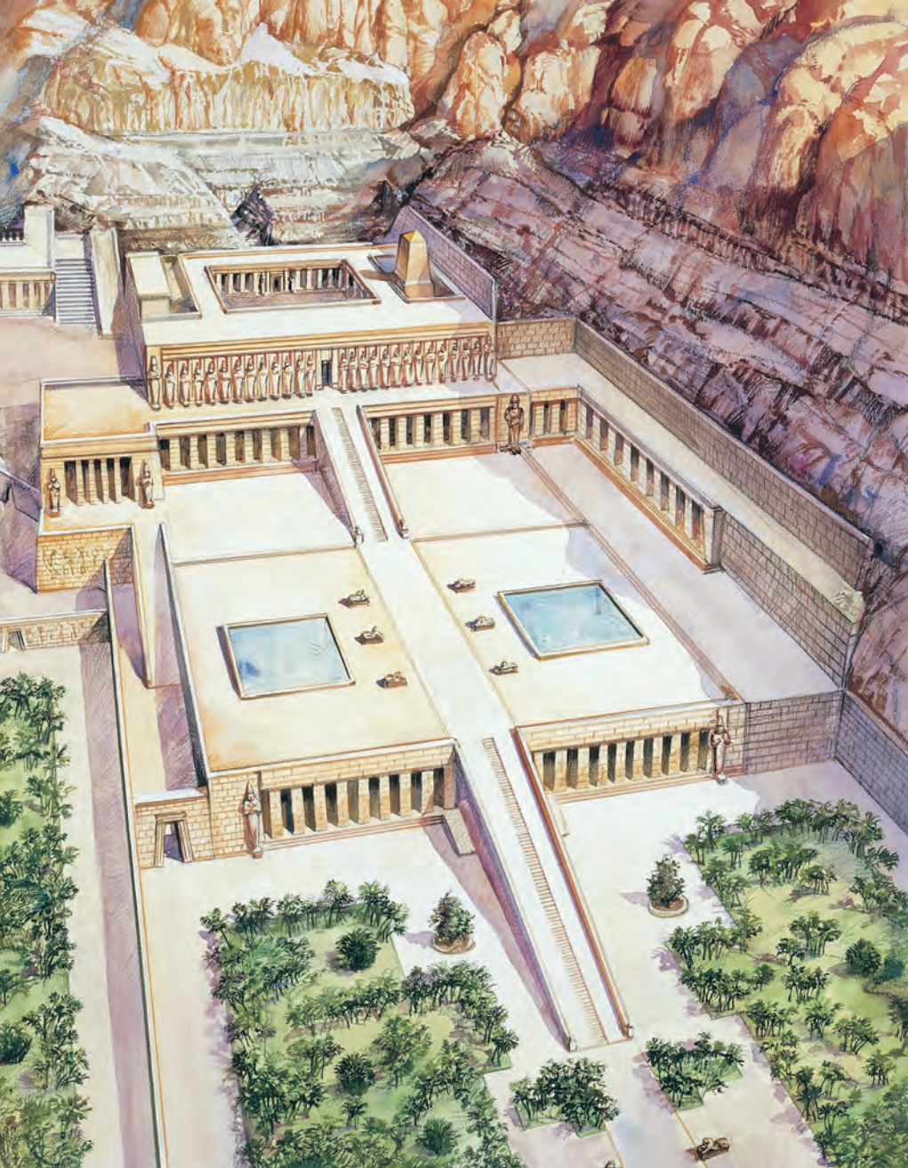
XII. Ha nem próbálták volna kitörölni az emlékét, Hatsepszt templomát a mai napig is hűséges papok serege vigyázná. Bár a komplexum teljesen elhagyatott, egyedülálló építészeti remekmű