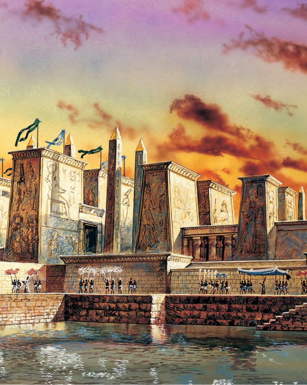
IX. A thébai Karnak templomának lenyűgöző pülónjai, obeliszkei és belső udvarai mind Amon-Ré tiszteletét hirdetik