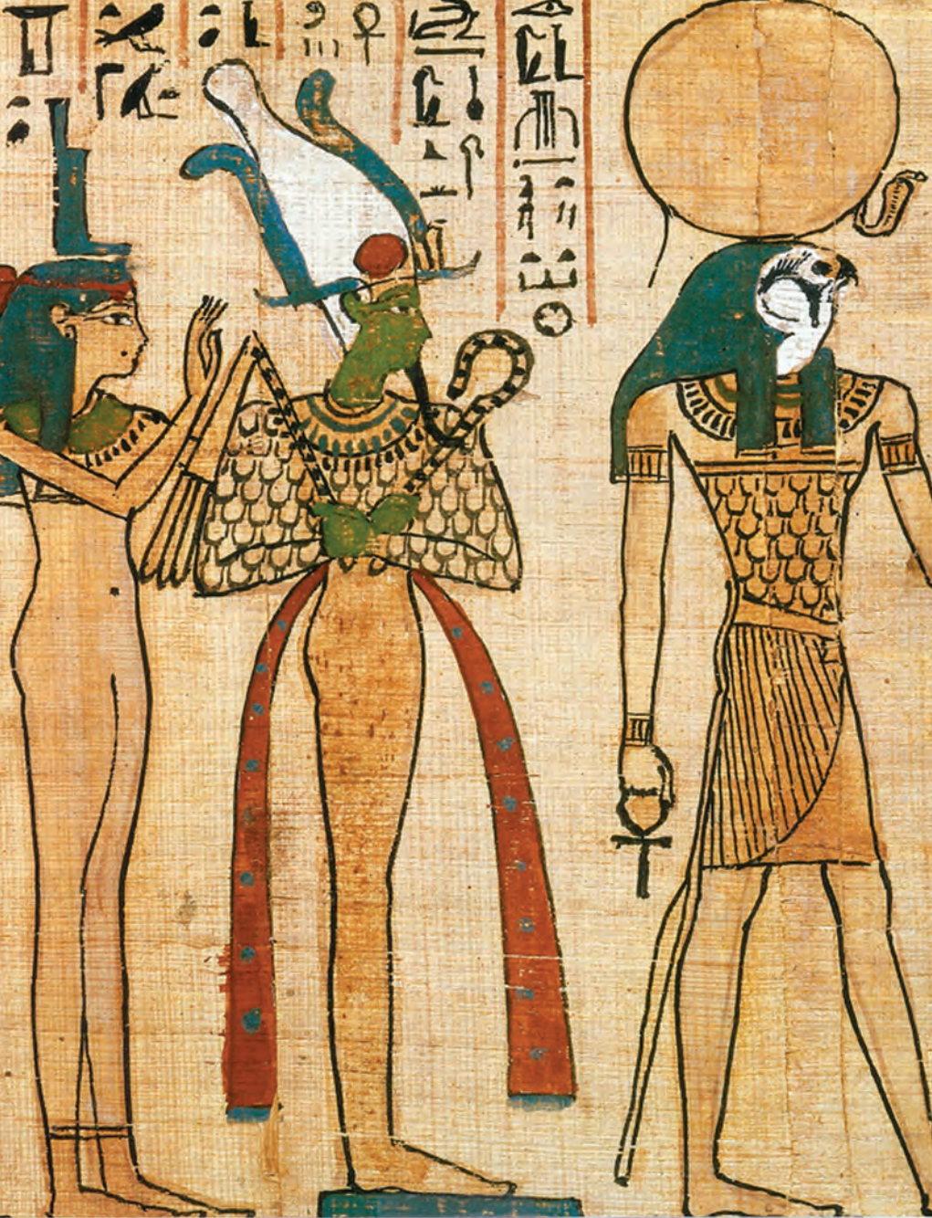
VIII. Ízisz istennő és néhai férje, Ozirisz, végtelenül büszkék sólyomfejű gyermekükre, Hóruszra, aki mindig az aktuális fáraóban ölt testet